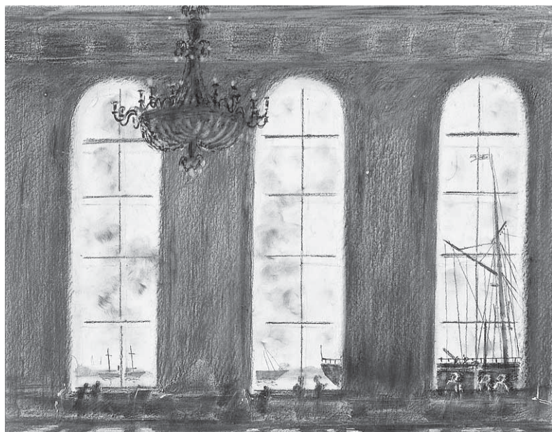
Рисунок архитектора А. Никольского из серии «Эрмитаж в дни блокады». 1941–1942 гг. Бумага, карандаш.

Школьная комната (из 1-й тетради: рисунки переходов, залов и комнат Эрмитажа). Государственный Эрмитаж, Санкт-Петербург